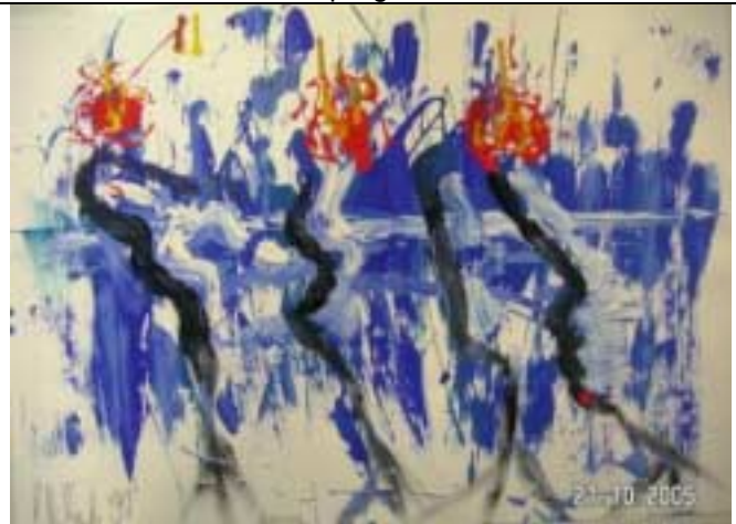
Informel: Freie Farben und Strukturen – 2 -