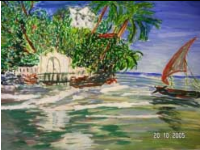
Erfassen des farblichen Eindrucks – 1 -