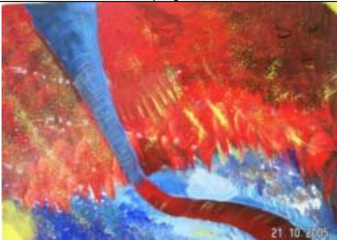
Informel: Freie Farben und Strukturen – 1 -