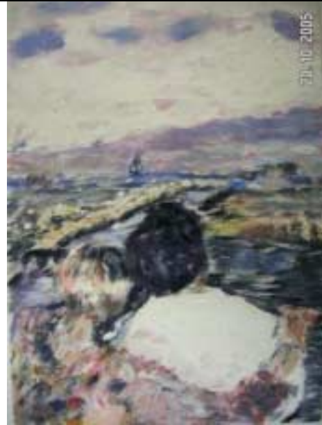
Erfassen des farblichen Eindrucks – 2 -