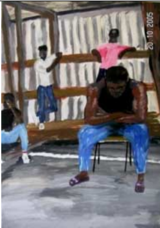
Formen und Farben prägen den Ausdruck – 1 -